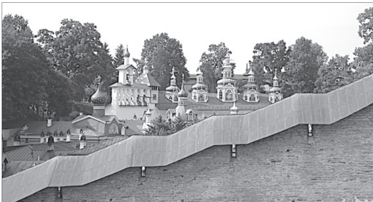
Свято-Успенский Псково-Печерский монастырь

В настоящее время есть несколько версий, касающихся происхождения Княжны Ольги. Одна из них предполагает, что Ольга Мудрая родилась в селении Выбуты (Лыбутино) на Псковской земле в княжеской семье Изборских. Псковичи чтут святую Ольгу. В центре города ей установлен памятник, у подножия которому проводятся многие мероприятия. Такие как чествования молодоженов или парад колясок, как в последние дни июля во время празднования Дня города Пскова.