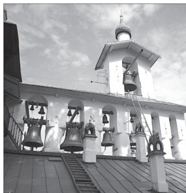
Звонница Псково-Печерского монастыря

Далее наш путь лежал в Изборск — еще одно замечательное место. Здесь находится мощная каменная крепость, построенная в 14 веке, которая выдержала десятки вражеских осад и сохранилась до наших дней, являясь выдающимся памятником оборонного зодчества Древней Руси. Крепость почти неприступна из-за крутых склонов и выкопанных рвов. Стены и башни крепости