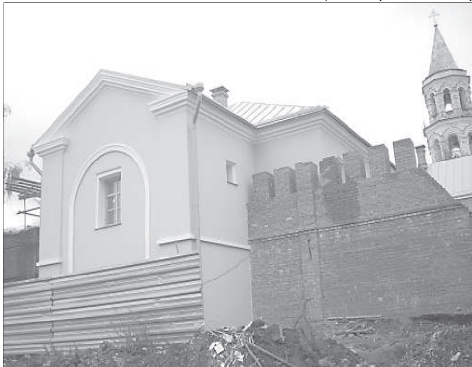
■ Братский корпус монастыря (вид с ул. Старицкой)

В публикации использованы материалы краеведческого альманаха под редакцией Н.А. ЛОПАТИНОЙ