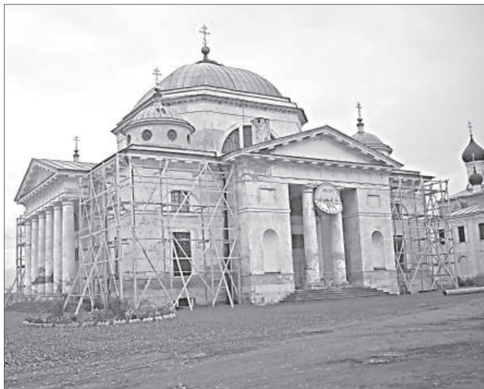
■ Главный собор монастыря

Продолжаются восстановительные работы Ново-Вознесенской церкви на улице Старицкой. В настоящее время ведутся кровельные работы на куполах. И без нее невозможно представить себе облик нашего старинного города. И это церковное здание со своей удивительной и трагической историей. Во время войны церковь могла служить оборонительным объектом на подступах к