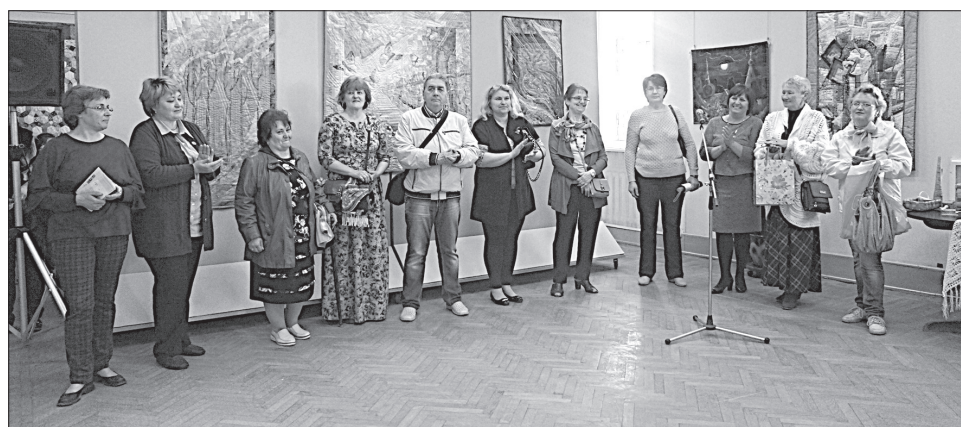
На выставке представлены работы 30 авторов. Мастера приняли участие в открытии выставки

В этом году 30 мастеров представили на суд зрителей свои работы. Выставка будет работать до 28 июня. В рамках городского фестиваля произведений художников, мастеров художественных ремесел и декоративно-прикладного творчества «Привези мне из Торжка...» пройдут также мастер-классы: от художественной студии «Блик», по золотному шитью и резьбе по дереву отделения золотного шитья и декоративно-прикладного искусства педагогического колледжа, росписи новоторжской игрушки, по плетению из бересты, по войлоку и другим.